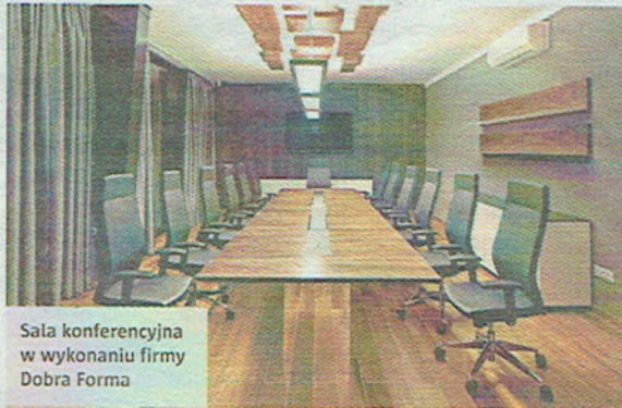
Sala konferencyjna w wykonaniu firmy Dobra Forma

df DESIGN Your life dobra forma WWW.DOBRAFORMA.COM